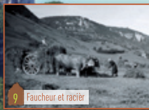
9 Faucheur et racier