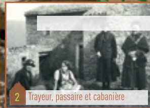
2 Trayeur, passaire et cabanière