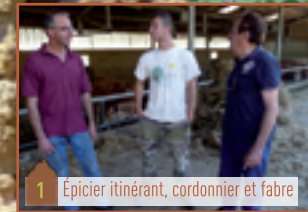
1 Epicier itinérant, cordonnier et fabre