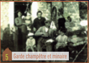
5 Garde champêtre et minaire