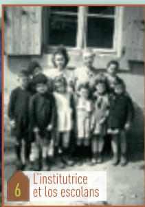
6 L'institutrice et les escolans