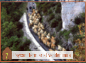
7 Paysan, fermier et vendemiaire