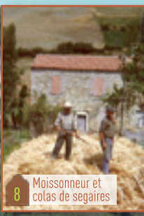
8 Moissonneur et colas de segaires