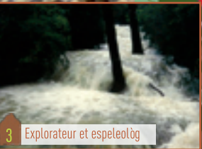
3 Explorateur et espeleolog