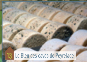
13 Le Bleu des caves de Peyrelade