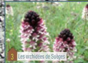
3 Les orchidées de Suèges