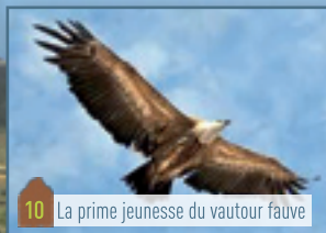
10 La prime jeunesse du vautour fauve