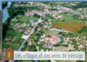
8 Des villages et des voies de passage