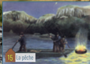
15 La pêche