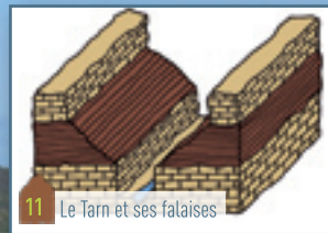
11 Le Tarn et ses falaises