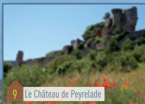
9 Le Château de Peyrelade