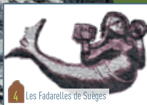
4 Les Fadareilles de Suèges