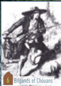
6 Brigands et Chouans