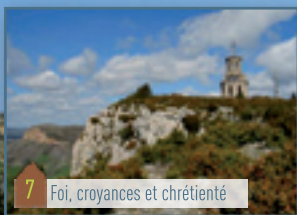
7 Foi, croyances et chrétienté