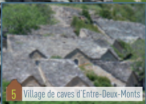
5 Village de caves d'Entre-Deux-Monts