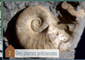
2 Des pierres précieuses

LA VARIANTE DU PIEDESTAL EST PARTICULIEREMENT SPORTIVE