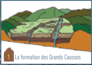
1 La formation des Grands Causse