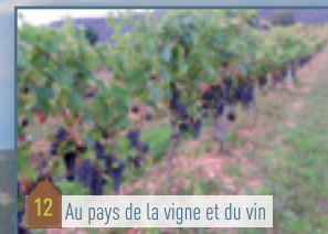
12 Au pays de la vigne et du vin