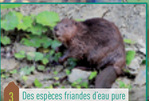
3 Des espèces friandes d'eau pure