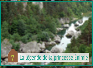
7 La légende de la princesse Énimie