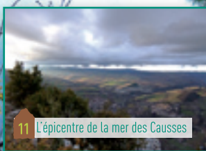
11 L'épicentre de la mer des Causses