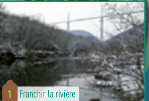
1 Franchir la rivière