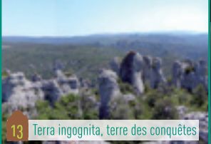
13 Terra ingognita, terre des conquêtes