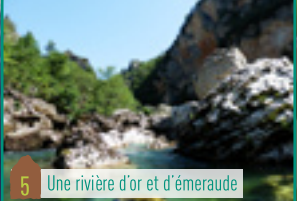
5 Une rivière d'or et d'émeraude