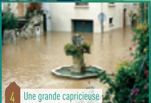
4 Une grande capricieuse