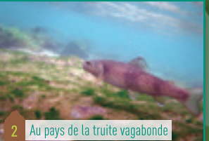
2 Au pays de la truite vagabonde