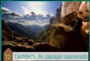
12 L'architecte des paysages caussenards