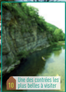
10 Une des contrées les plus belles à visiter