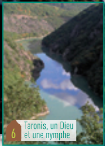
6 Taronis, un Dieu et une nymphe