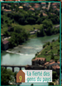
9 La fierté des gens du pays